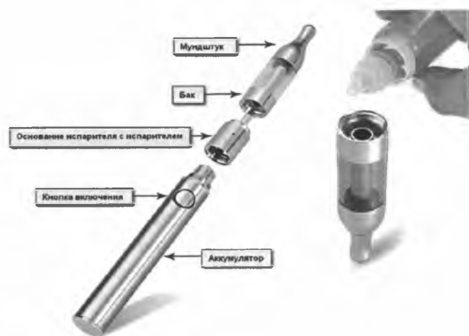
Рис. 3. Устройство электронной сигареты

Обычная электронная сигарета состоит из аккумулятора, электрического испарителя, емкости для жидкости, мундштука и дополнительных элементов для автоматического управления подачей аромажидкости (но последние имеются не во всех моделях), рис.3.