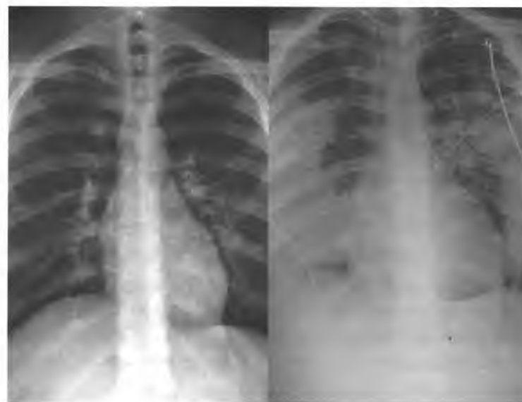
Рис.6. Здоровые легкие (слева) и легкие после 5 дней использования вейп-устройства

как: «Повреждение легких, связанное с употреблением электронных сигарет или продуктов вейпинга». Данное заболевание будет внесено в МКБ-11, а пока CDC рекомендует кодировать эту болезнь другими подобными заболеваниями. EVALI может отражать спектр болезненных процессов, а не один конкретный процесс. Отдельные сообщения о заболеваниях легких, связанных с вейпингом, описывают острую эозинофильную пневмонию, диффузное альвеолярное кровоизлияние, липоидную пневмонию, и респираторный бронхиолит, ассоциированный с интерстициальным заболеванием легких (рис.6).