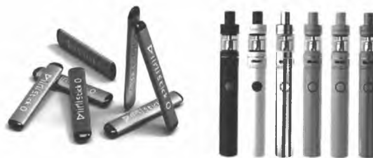
Рис. 5. Одноразовые (слева) и многообразные (справа) электронные сигареты

Одноразовые ЭС рассчитаны на 200 - 500 затяжек пара. В многообразных устройствах нет таких ограничений и они работают до тех пор, пока доливается жидкость в емкость.