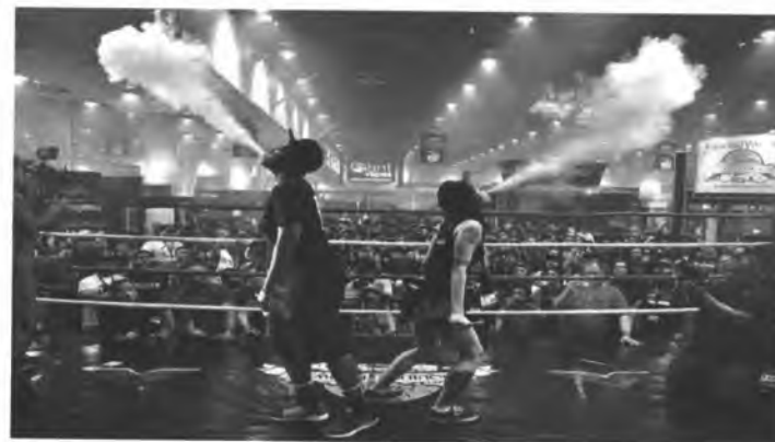
Рис. 2. Вейпинг соревнование

Быстрому распространению курения ЭС (вейпингу) способствуют компании-производители, которые превратили курение ЭС в целую субкультуру. В мире на регулярной основе проводятся субсидируемые компаниями-производителями выставки и соревнования среди курильщиков ЭС (рис.2). Это так называемые: «Cloudchasing» (мастерство выдувания облаков пара), «Tricks» (трюки с паром) и «Вейпинг-алхимия» (соревнования по составлению новых жидкостей для вейпа).